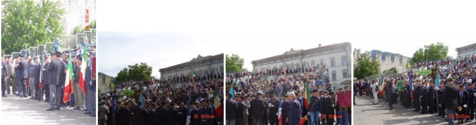
Piazza Trento Fiera : Le Bandiere dei Gruppi delle varie regioni, sullo sfondo il Palazzo del Vescovo