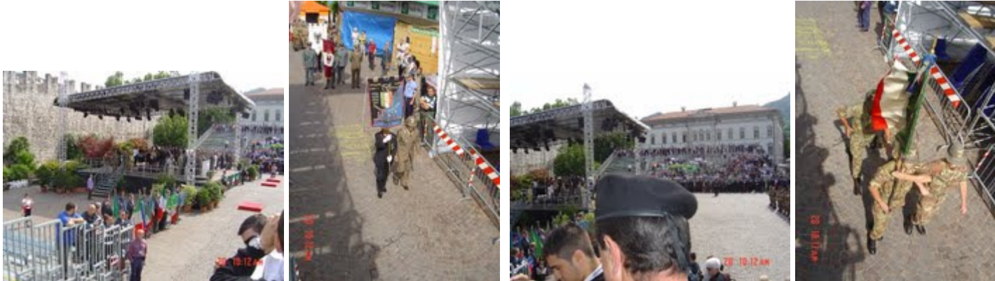
Piazza Trento Fera : I medaglieri delle Associazioni d'Arma, ANGeT, ... la bandiera di guerra del 2° rgt Genio