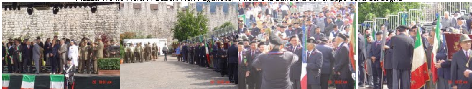
Piazza Trento Fiera : Le Mura antiche, la Tribuna delle Autorità e i vari Gruppi di Rappresentanza della Sardegna, ... della Lombardia ...