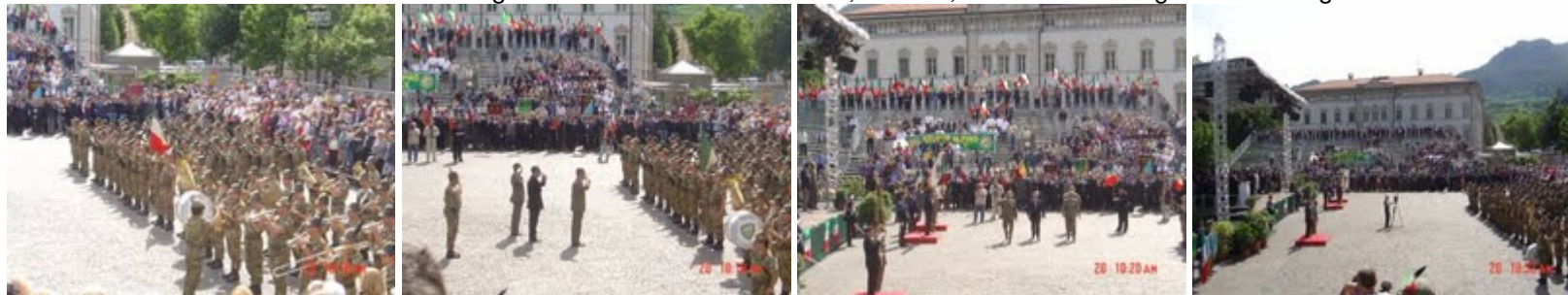
Piazza Trento Fiera : Il Comandante del 1° FOD passa in rassegna lo schieramento