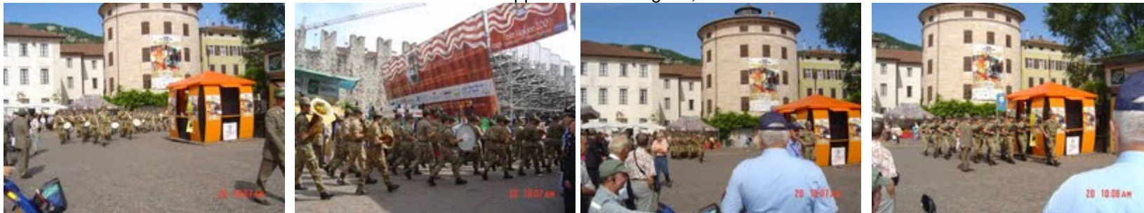
Piazza Trento Fiera : Arriva la Banda della Brigata Alpina Julia seguita dai Reparti in armi del Genio Guastatori e Trasmissioni